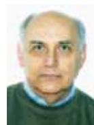
di Danilo Rossetti

G li ioni sono atomi o molecole che, avendo perso o acquisito un elettrone, si sono caricati positivamente o negativamente: la natura produce in abbondanza sia ioni positivi che negativi in proporzioni pressoché uguali (circa 5 ioni positivi per 4 negativi). La formazione di ioni nell'aria inizia quando la molecola gassosa riceve una quantità di energia sufficiente a emettere un elettrone. La maggior parte degli ioni negativi sono creati sulla crosta terrestre nel decadimento del radio naturale a gas radon. In natura però esistono fenomeni quali: temporali, fulmini, raggi solari ultravioletti, frizione generata da grandi masse d'aria che si muovono rapidamente sopra la terra, cascate d'acqua (effetto fotoelettrico di Lenard), che ne alterano la composizione modificano lo stato neutro in uno stato di instabilità chiamato ione.